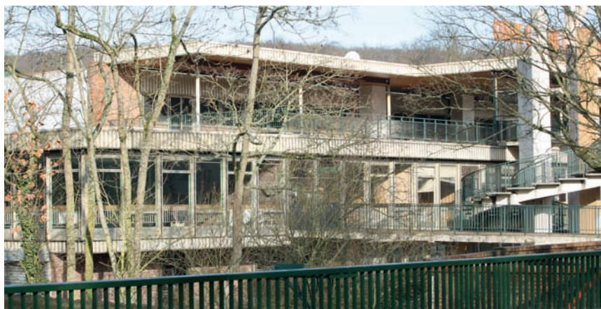
L'ancien bâtiment du CEC ne sera bientôt plus qu'un souvenir.

A terme, c'est un véritable complexe culturel, doté d'une salle de spectacles, d'une médiathèque, d'une salle de conférence et de locaux adaptés aux activités socio-